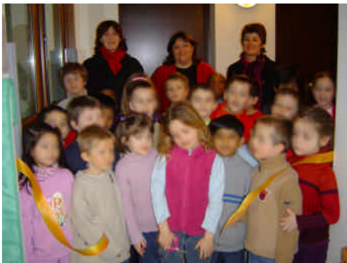
Inauguration de la nouvelle classe